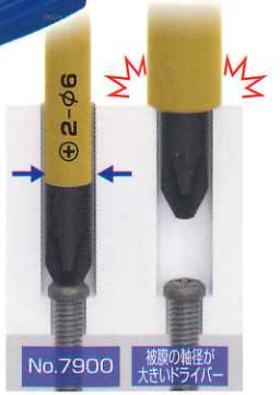
No.7900 被覆の軸径が大きいドライバー