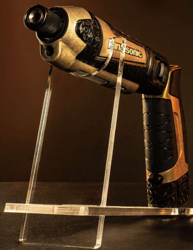
Panasonic EZ7521 用