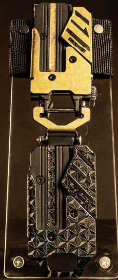
TAJIMA SF-MHLS2M 用