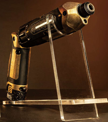
Makita TD022D 用